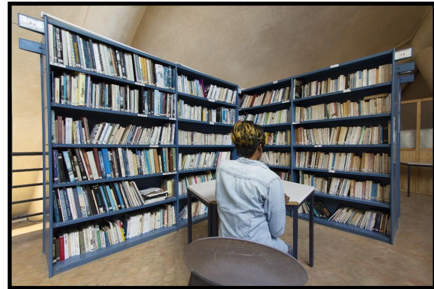
Une réfugiée congolaise étudie à la bibliothèque de la FOO à Rabat

1 seule personne forcée à fuir c'est déjà trop.