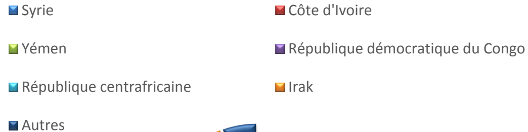
Réfugiés au Maroc - par Nationalité

1 seule personne forcée à fuir c'est déjà trop.