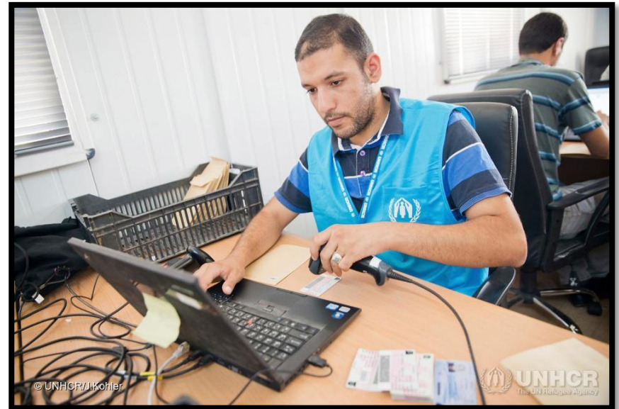
Le processus d'enregistrement

1 seule personne forcée à fuir c'est déjà trop.