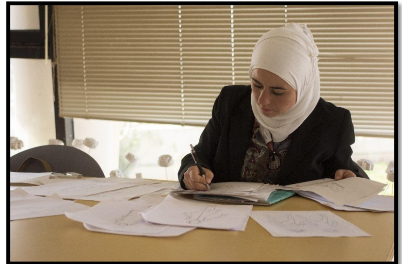
Une réfugiée syrienne qui a bénéficié de l'appui de l'AMAPPE

1 seule personne forcée à fuir c'est déjà trop.