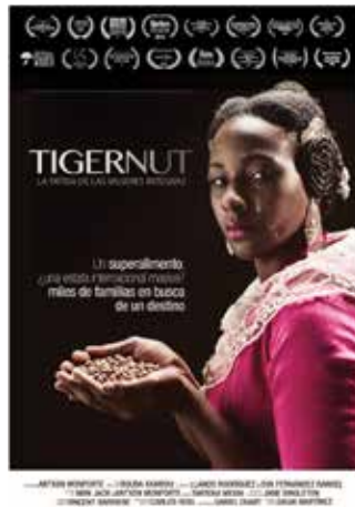
TIGERNUT Jueves 4 octubre 2018 19:30h Coloquio: Derecho a la alimentación