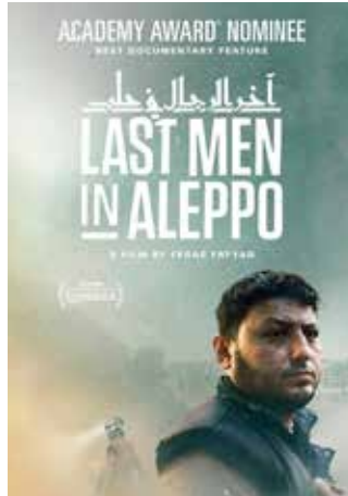
LAST MEN IN ALEPPO Viernes 21 septiembre 2018 19:30 h Coloquio: Migraciones y refugio / Violencias urbanas