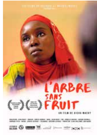
THE FRUITLESS TREE Jueves 27 septiembre 2018 19:30 h Coloquio: Derechos de la mujer